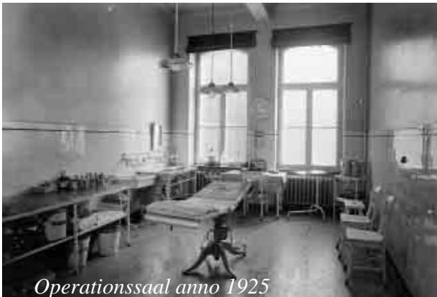
Operationssaal anno 1925

Die stark angewachsene bauliche Ausdehnung der Stadt Hattingen macht es erforderlich, für die neuen Straßen besondere Namen zu finden bzw. nicht mehr zeitgemäße Straßennamen umzuändern.