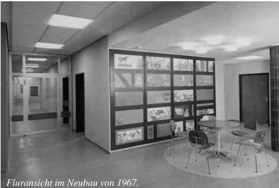
Fluransicht im Neubau von 1967.

..... Dem Arzt steht immer der ganze Mensch als Subjekt gegenüber, und es kann nur die Frage sein, ob das Schwerkraft der Therapie im jeweiligen Moment auf operati-