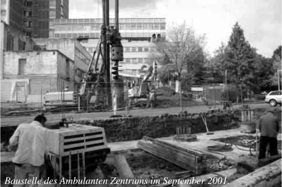
Baustelle des Ambulanten Zentrums im September 2001.

Krankenhaus. Aufstellung eines Computer-Tomographen in Apparatgemeinschaft mit dem Krankenhaus.