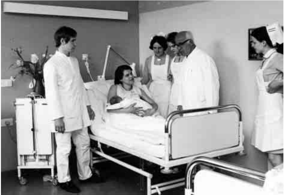
Die beiden Bilder auf dieser Seite zeigen den ersten Krankenpflege-Kurs nach Wiederaufnahme des Ausbildungsbetriebes

der Kosten zur Verfügung gestellt wurde, aber ausdrücklich nur für Neubauten, auf keinen Fall für Renovierung, Anbauten oder ähnliches Flickwerk.