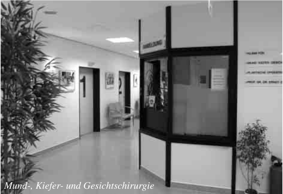
Mund-, Kiefer- und Gesichtschirurgie