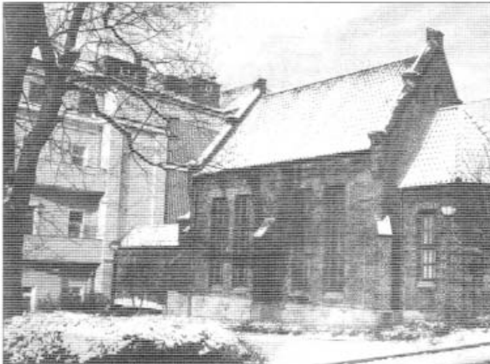
Direkt nach dem Krieg feierten die evangelischen Christen viele Jahre ihre Gottesdienste in der Kapelle der Augusta-Krankenanstalten.