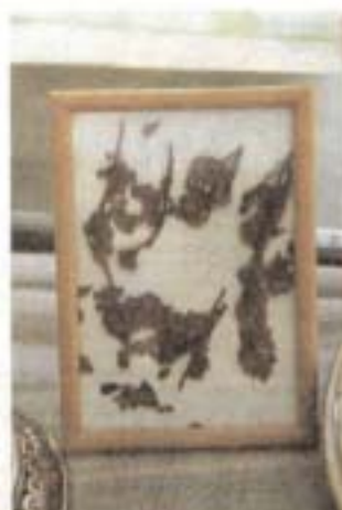
Fliederblüten – 60 Jahre alt. Im Holzrahmen bewahrt das Paar Teile des Brautsträußes.