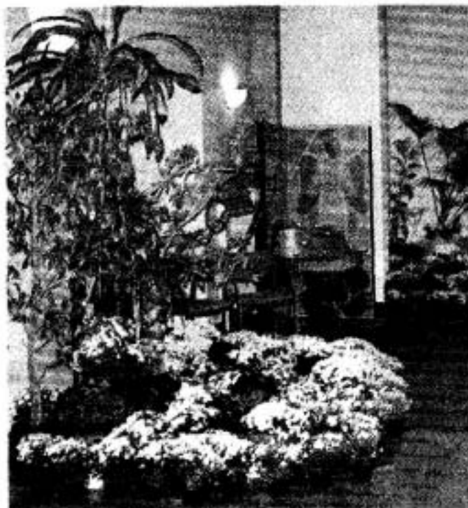
Welch eine Blumenpracht! Das Paradies auf Zeit lädt ein zum Genießen, Entspannen und Nachdenken.

..... Bis zum 13. Oktober ist der Paradiesgarten täglich von 9.30 bis 21 Uhr geöffnet. Der Eintritt ist frei.