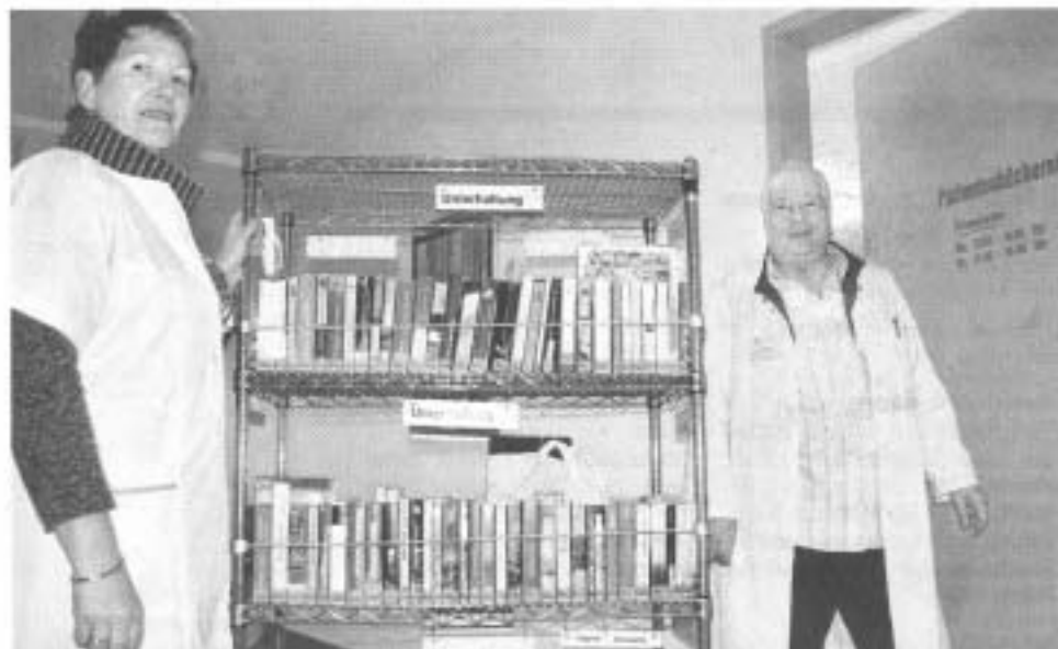
Die „grünen Engel“ übernehmen viele Aufgaben im Krankenhaus. Ehrenamtlich.

Und sie selbst, wie kommt sie damit klar, ständig mit Krankheit und Schicksalsschlägen konfrontiert zu sein? „Jeder, der bei uns anfängt, bekommt zunächst eine Einführung und macht ein Gesprächsführungs-Seminar mit. Außerdem treffen wir uns regelmäßig zum Erfahrungsaustausch und können jederzeit die beiden fest angestellten Seelsorger um Rat bitten.“ • Raffaels Römer