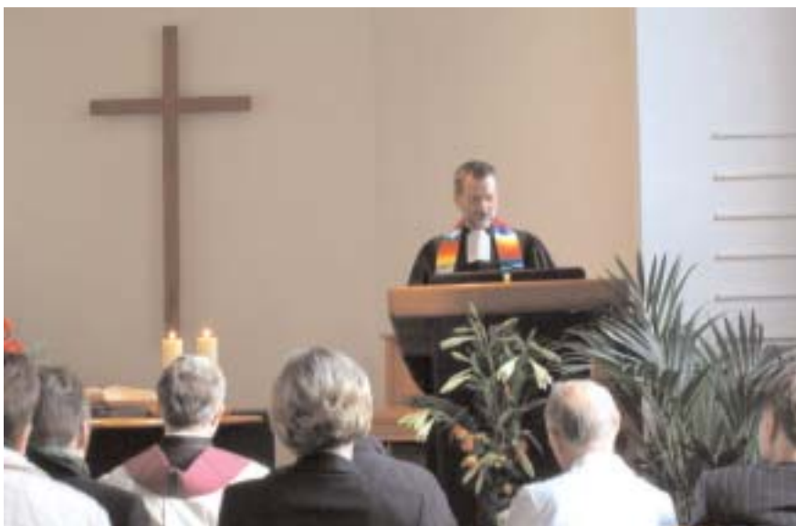
Der ökumenische Festgottesdienst wurde gleich dreimal gefeiert, damit alle Platz fanden, die kommen wollten.