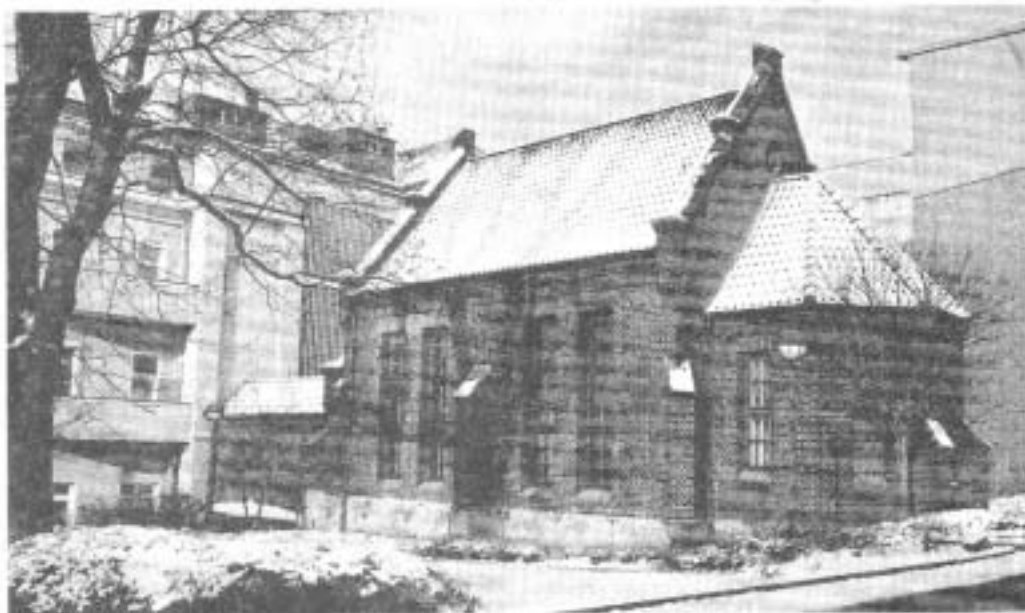
Vor 100 Jahren wurde die Kapelle der Augusta-Kranken-Anstalt gebaut. Die Seelsorger der Klinik wollen mit einer Ausstellung daran erinnern.