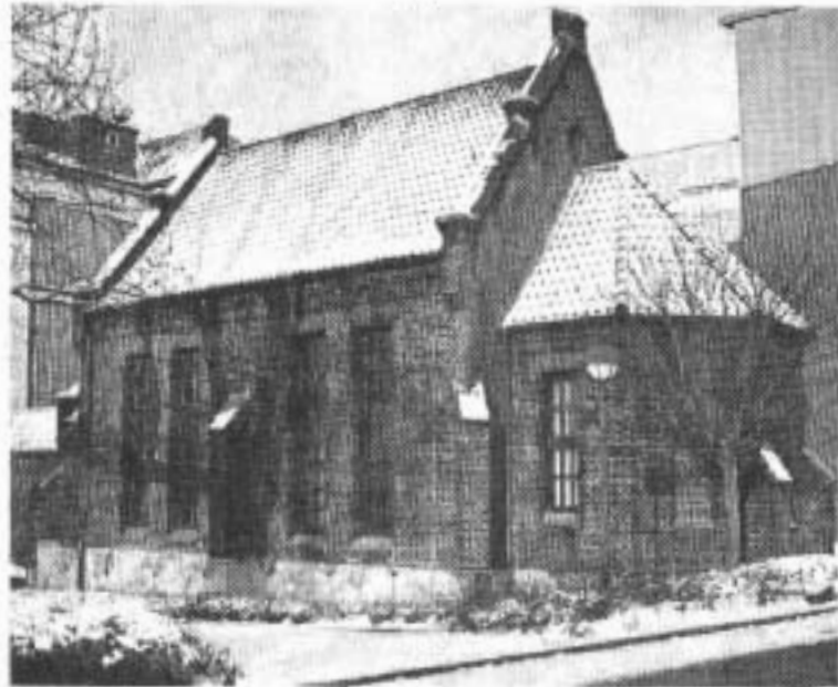
Die Kapelle der Augusta-Krankenanstalt blieb als einziges Gotteshaus im Zweiten Weltkrieg unbeschädigt.

Jeder, der etwas beitragen kann, alle Einsender nehmen an einer Verlosung teil. Zu gewinnen gibt es tolle, aber im-