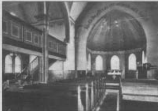
Die Augusta-Kapelle im Jahre 1928.

schon darauf. Und auf die ökumenischen Gottesdienste in der Form eines Salbungsgottesdienstes mit persönlichem Segen, auf die weiteren Ausstellungen und die geplante Fenster-Malaktion mit Schülerinnen und Schülern der benachbarten Hildegardis-Schule, die Teil des Jubiläumsprogramms sind. Die beiden Theologen hoffen für diese Programmstationen auf eine ebenso gute Resonanz wie bei der jüngsten Informationsveranstaltung zum Thema Nahtod, die mit gut 170 Besuchern glänzend besucht war. EF