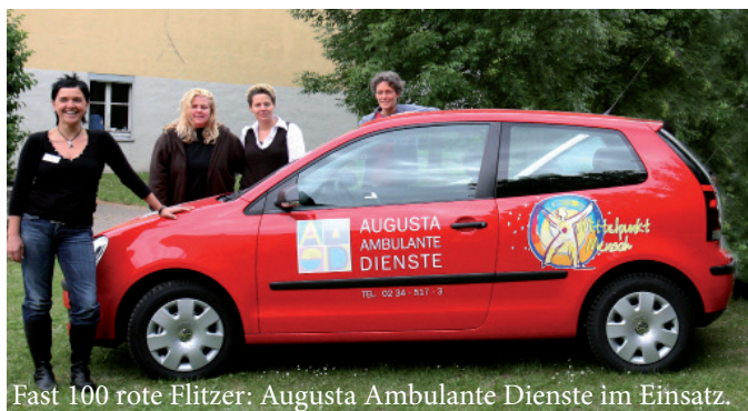
Fast 100 rote Flitzer: Augusta Ambulante Dienste im Einsatz.

nicht weniger als 820 Patienten.“ Lachend fügt der Chef an, dass inzwischen 48 Computer mit ihrer seit damals deutlich gesteigerten Rechenleistung da-