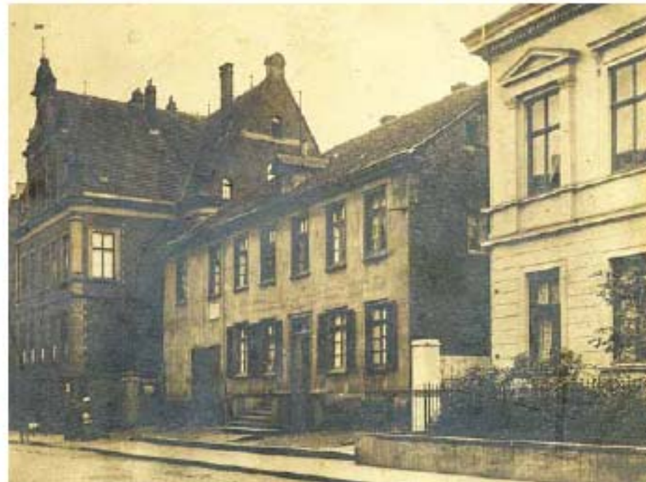
Hier begann alles: Augusta 1864 in der Brückstraße.