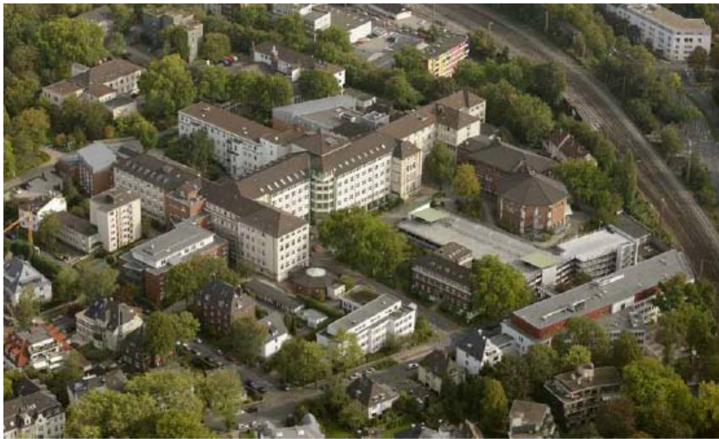
So sieht es heute aus: Ein aktuelles Luftbild der Augusta-Kliniken an der Bergstraße.