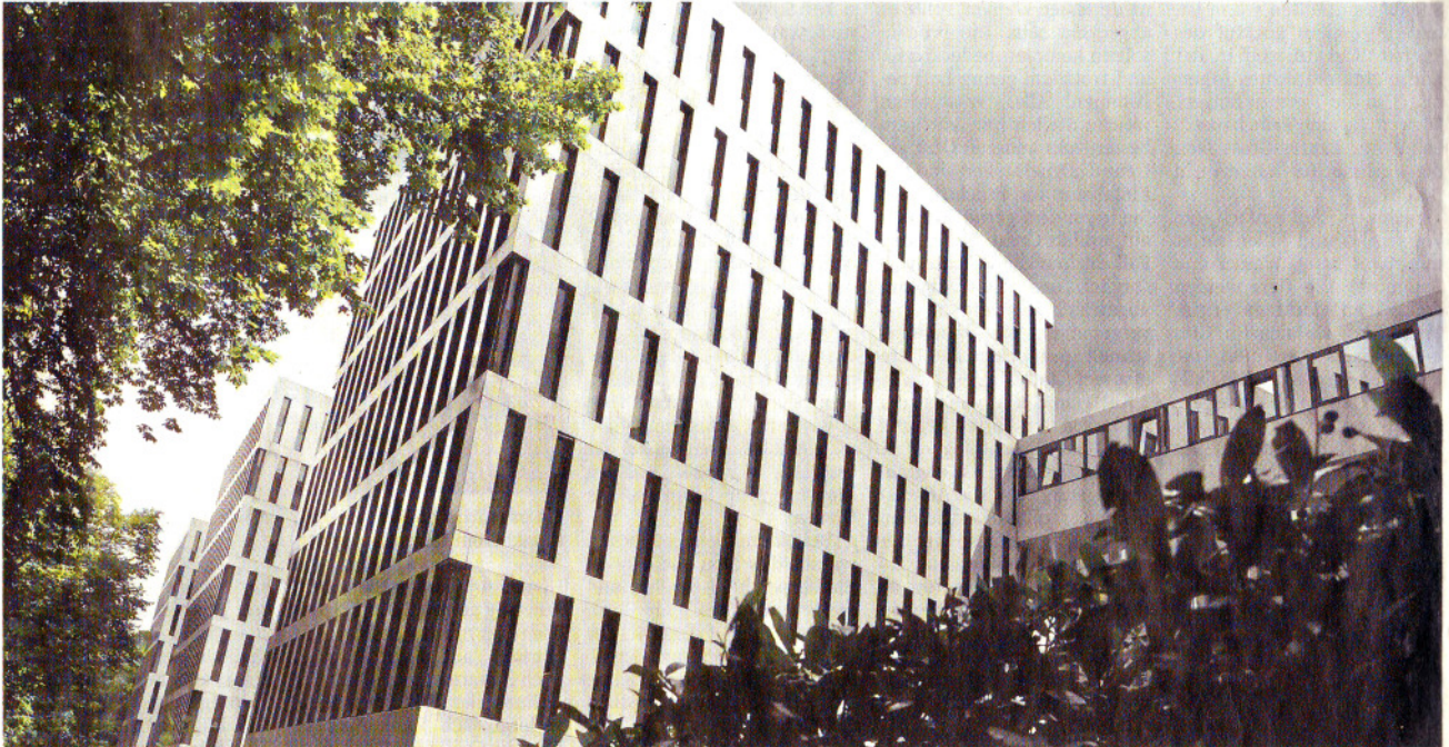
Nur eines von einigen imposanten Bauwerken in unserer Stadt: 2006 wurde der Neubau des Aral/BP-Gebäudes an der Wittener Straße eingeweiht. Entworfen wurde es von einem Büro aus Hamburg, ausführender Architekt war Kai Richter.

Einmal hinter die Fassaden schauen, gucken, wie Architekten heute bauen, sehen, wie Menschen wohnen. Das geht am Tag der Architektur, der morgen beginnt. Das ganze Wochenende sind Wohnhäuser und öffentliche Gebäude Publikumsmagneten. Allein in NRW werden an 440 Bauwerken in 151 Städten und Gemeinden die Türen weit geöffnet sein. In Bochum gilt es, sieben Gebäude von unterschiedlichen Architekten zu entdecken. Wir haben für Sie die Termine zusammengetragen und ein Interview mit zwei Experten geführt.