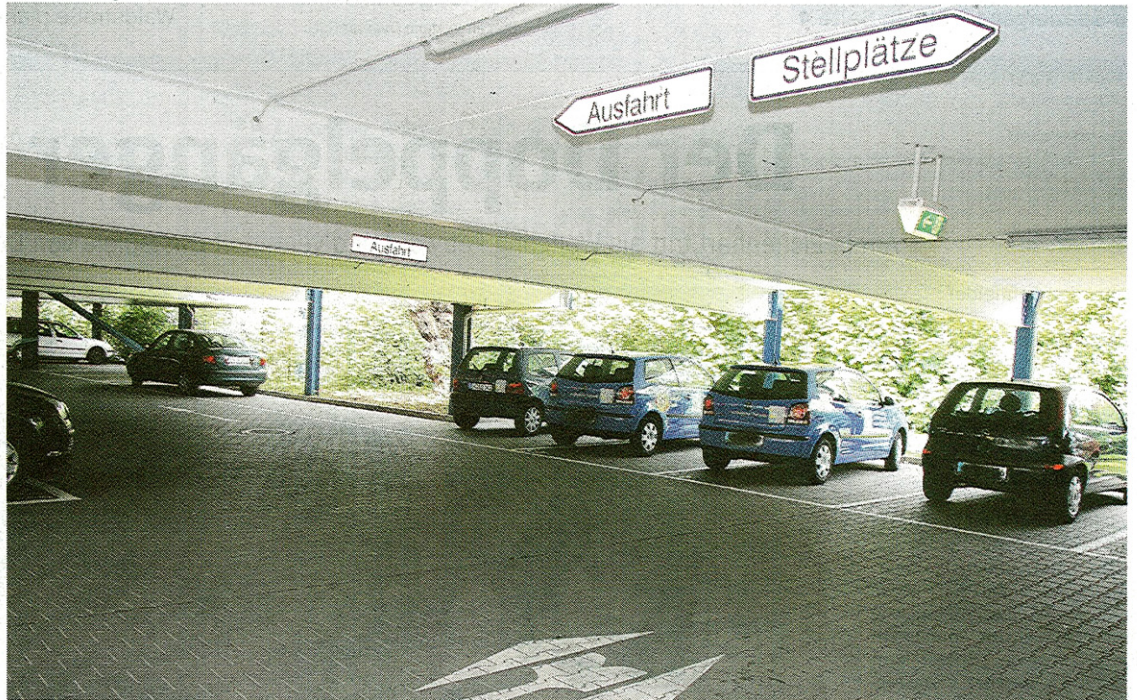
Parken unter dem Dach: Am Ev. Krankenhaus gibt es mit 375 Stellflächen die meisten der Hattinger Krankenhäuser.

Liebelt, Unternehmensbeauftragte für Öffentlichkeitsarbeit. Die Einfahrt führt von der Essener Straße auf zwei gepflasterte Parkflächen. Dort gibt es einen Platz für Behinderte. Zum Teil sind Flächen für das Personal reserviert. „Ein weiteren Park-Bereich gibt es hinter dem Haus“, erläutert sie. Dabei folgt der Besucher der Einfahrt dorthin, wo auch die Parkplätze der Verwaltung liegen. Wohin ausweichen, wenn es voll ist? An der Essener Straße gibt es nur wenige Parkbuchten.