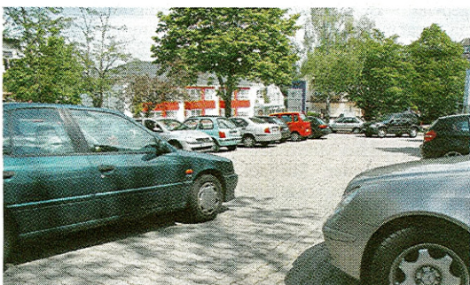
St. Elisabeth in Niederwengern: die 71 kostenlosen Parkplätze vor dem Haus sind begehrt.

nen schräg gegenüber den Gebäuden. Die hinteren sind etwas weiter entfernt, Besucher gehen wenige Minuten. „Bis zu 300 Parkplätze stehen zur Verfügung“, sagt Sprecher Oliver Niggemann. Die kostenlosen Stellplätze seien ein Standortvorteil. Besucher müssten nicht das Wohngebiet belasten, sagt er. Hinzu kommen zwei Plätze für Schwerbehinderte.