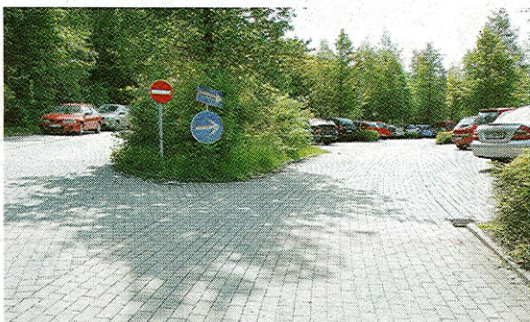
Parken wie im Park: Plätze für Besucher liegen langgezogen schräg gegenüber der Reha-Klinik.