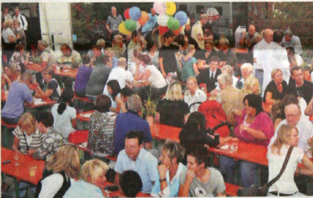
Großer Auflauf im Augusta-Krankenhaus: Nach anstrengenden Besichtigungstouren legten die Gäste gerne eine Pause auf dem Parkdeck vor der Bühne ein.