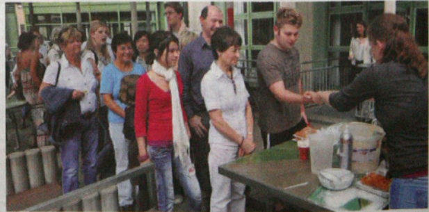
Schlange stehen am Waffelstand: Die Mitarbeiterinnen buken, was das Zeug hält, um dem Ansturm gewachsen zu sein.