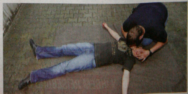
Der Auftakt zur stabilen Seitenlage: Viele wissen nicht mehr, wie man sie anwendet.