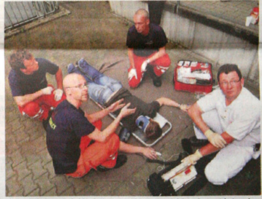
Die Ersthilfe ist entscheidend: Notarzt und Rettungssanitäter demonstrierten einen Rettungseinsatz.