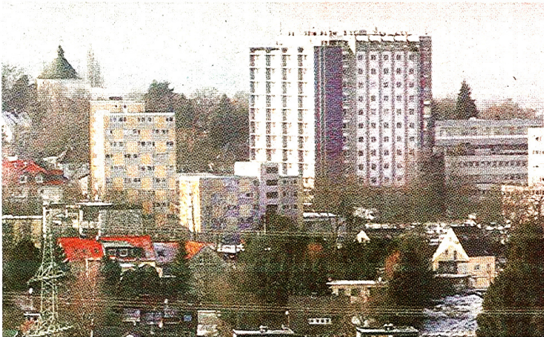
Das 14-stöckige Bettenhaus des EvK ist schon aus weiter Ferne sichtbar. Umgeben ist das Gebäude von Behandlungstrakt und Verwaltungsflügel.