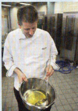
Hier legt der Chef noch selbst Hand an: Soßen und Fonds werden alle selbst hergestellt. Geschmacksverstärker? Nö.